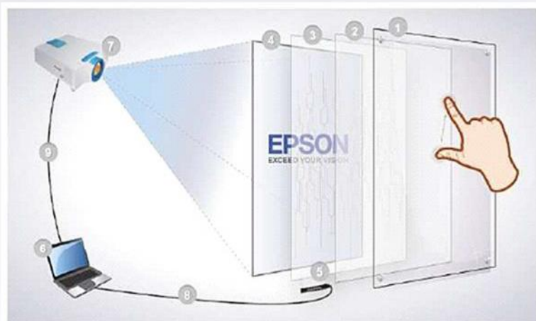
Aufbau mit Touch Folie